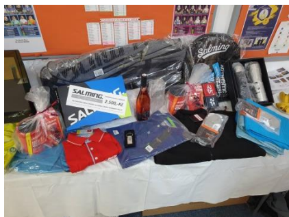
Na tombole bylo plno

- V sobotu bylo na programu celkem 87 zápasů, což je o 5 více než včera a z nichž opět žádné nebyly skrečovány. Celkově tedy z 87 utkání jich bylo 9 pětisetových a 11 čtyřsetových. Zbýlých 67 zápasů se hrálo jen na tři sety. Z toho plyne, že celkem bylo odehráno 290 setů, což činí stejně jako i včera průměr 3,33 setu na zápas.