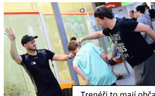
Trenéři to mají občas těžký 😊